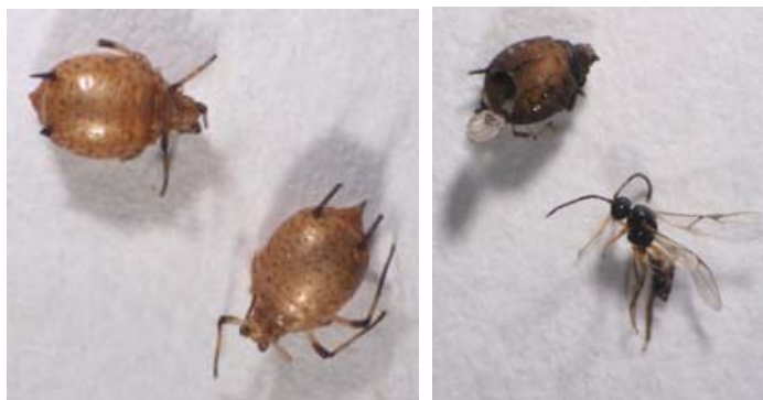
Sliki 2 in 3: Mumiji listnih uši (slika 2) in prazna mumija ter izleteli parazitoid (slika 3).

Večinoma razlikujemo 4 stopnje ličink (larvalne stopnje), vendar poročajo tudi o drugačnem številu. Na ličinki 1. stopnje so jasno razločljivi telesni deli in nakazane mandibule, ki so kaudalne (na repnem delu [ cauda ]). Segmentacija v 2., 3. in 4. stopnji ličinke je manj razločna in le 4. stopnja ličinke ima razvite mandibule. Preden ličinka zaključi z razvojem, oblikuje kokon znotraj ali pod kožo uši in se zabubi. V tem stadiju koža uši otrdi in nastane značilna mumija (sliki 2 in 3). Mumija uši ima vlogo varovalnih celic, znotraj katerih ličinka parazitoida zaključi njen razvoj do odraslega osebka. Prepupalni in pupalni stadij ter stadij imaga parazitoida se oblikujejo v mumiji (Cloutier in sod., 1981, cit. po Minks in Harrewijn, 1988). Imagi nato izletijo iz mumije skozi okrogle odprtine na zadku uši, ki ima pokrov in se zlahka predre. Pri večini vrst iz poddružine Aphidiinae je lahko ta odprtina kjerkoli na zadku ( abdomen ) uši, nekatere vrste pa specifično oblikujejo izhodno odprtino le na apikalnem delu zadka. Ravno izleteli parazitoide potrebujejo le kratek čas, da spolno dozori. Samci v enakih razmerah navadno izletijo nekoliko pred samicami. Parjenje sledi kmalu po izletu in traja le nekaj sekund (Starý, 1988, cit. po Minks in Harrewijn, 1988).