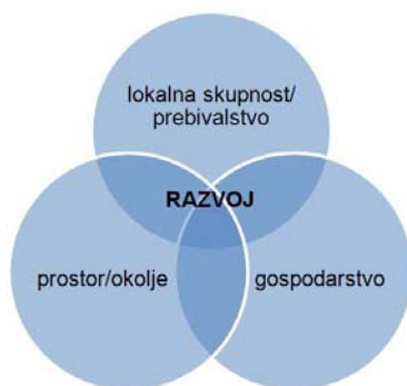
Slika 1: Usklajevanje okoljskega/prostorskega, socialnega in gospodarskega razvoja (Barbič, 2005:19)

Vsak od treh podsistemov (okolje/prostor, družba, gospodarstvo) deluje sicer po lastnih zakonitostih, hkrati pa so soodvisni. Torej razvoj posameznega podsistema ne sme ogroziti razvoja drugih dveh, temveč ju mora podpirati in prispevati k njuni vzdržnosti.